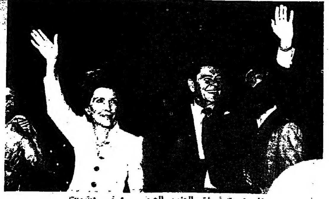
ريغان وزوجته في مؤتمر الحزب الجمهوري في شيكاغو

وانطلق معها ريغان بعينه التمثيل. وما لبث ان كسب ثقة المخرجين. مما يفتح له ابوابا بعد من الاشراف بكثر من خمسين فيلما.